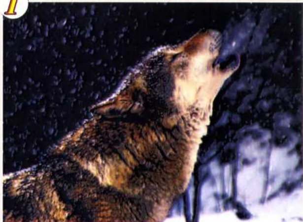
"Зов предков" Аль-Хаффаф Сафие ГОУ ЦО №1272