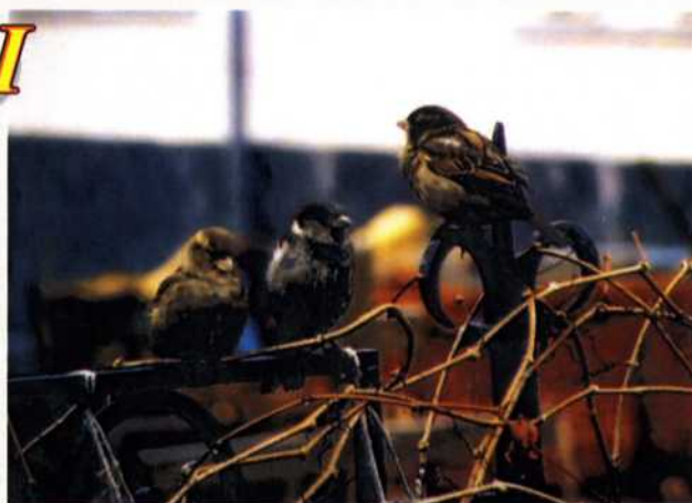
"Птичья школа" Лопес Мунис Иустины ЦО №1828