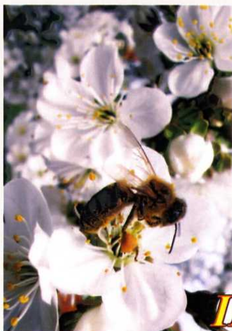
"Цветочный рай" Батуров Никита 1992г. Физико-математический лицей №1580